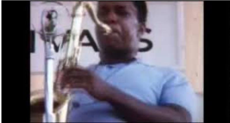
John Coltrane, Newport 66

https://www.youtube.com/watch?v=as1rTILOZDQ