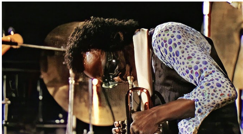
Miles Davis, Berlin 1973

https://www.youtube.com/watch?v=as1rTILOZDQ